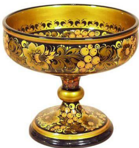
Чашка с «фоновой» росписью

Для «фоновой» росписи было характерно применение чёрного или красного фона, тогда как сам рисунок оставался золотым.