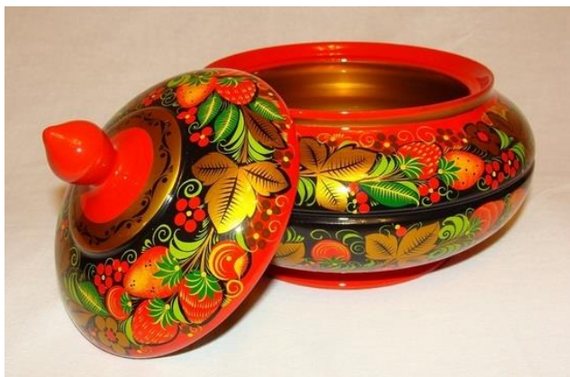
Рисунок в хохломской росписи строится на «ведущей», представленной плавной раскидистой ветвью. Она постепенно расширяется за счет добавления разнообразных элементов, подразделяемых на основные (крупные цветы, грозди ягод и т.д.) и побочные (мелкие листья, одиночные ягоды, травинки). При этом основной элемент должен находиться по центру.

Изначально хохломская роспись подразделялась на 2 категории, отличающихся стилистикой исполнения узоров: «верховое» письмо и «кудрину». Последняя стала наиболее известной — это темный (красный или черный) фон, по которому выписаны изящные и сложные завитки и природные элементы. Схема работы та же — сначала ведущая ветвь, затем добавочные детали. «Кудрина» выглядит более тяжелой, наполненной, нежели «верховое» письмо, которому свойственен золотой фон с обилием травинок разного размера, а остальные орнаменты выполняются или под ягодку, или под листок. Кроме того, само расположение рисунка должно представлять собой квадрат, который может вытягиваться в ромб.