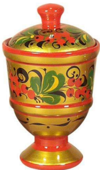
Солонка с «верховой» росписью

Для «фоновой» росписи было характерно применение чёрного или красного фона, тогда как сам рисунок оставался золотым.